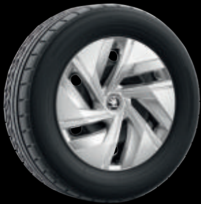
Cerchi in acciaio da 18" con copricerchio Andromeda