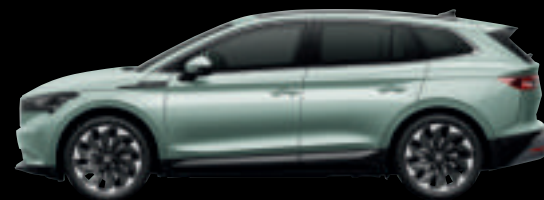
Grigio Artico Met.