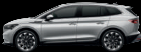
Argento Brillante Met.