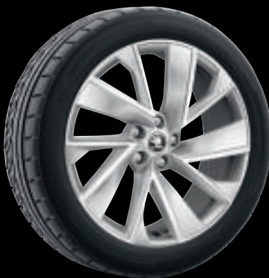
Cerchi in lega VEGA colore argento da 20"